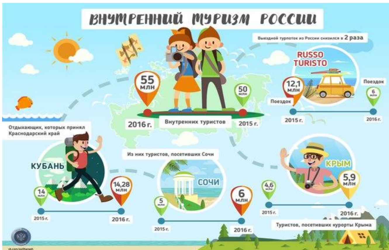
Пример использования инфографики в туризме.

В этой области возможно создание инфографики для объемных страноведческих, пространственных, статистических, знаковых и других массивов информации. Необходимо также отметить, что массив инфографики в сфере туризма на сегодня представлен достаточно широко [1].